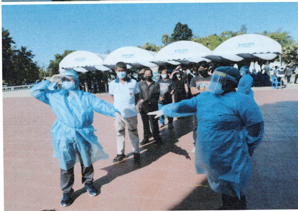
การตรวจคัดกรองในงานบุญต่าง ๆ