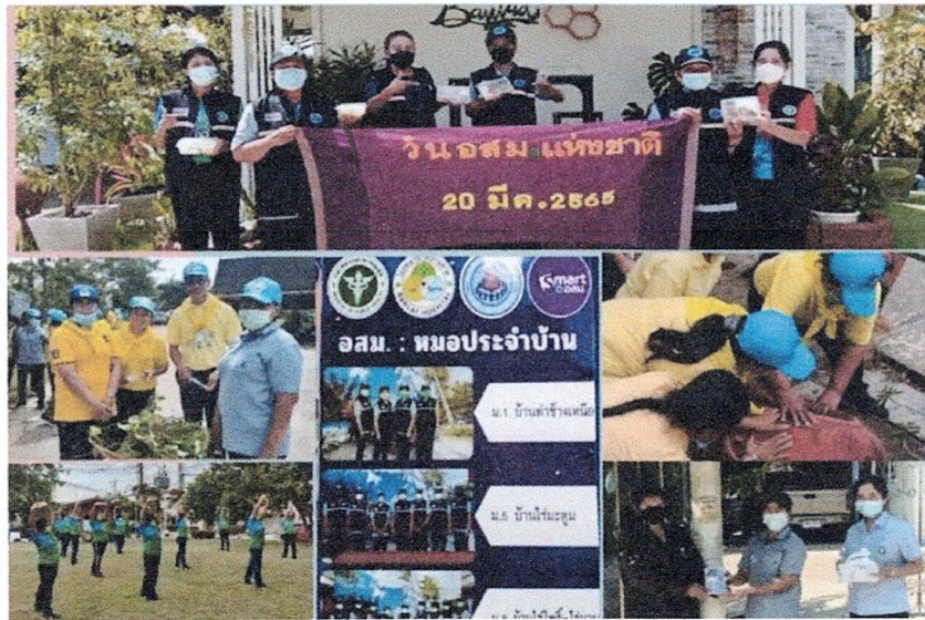
อสม.หมอคนที่ 1 ต้นแบบสุขภาพ ผู้นำจิตอาสา