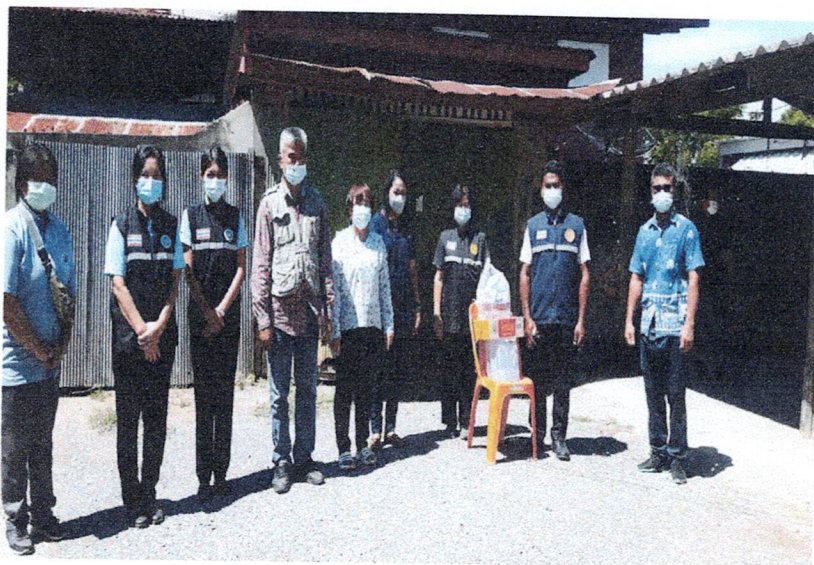
เป็นตัวช่วยเจ้าหน้าที่สาธารณสุขในการกักตัว HR และ HQ