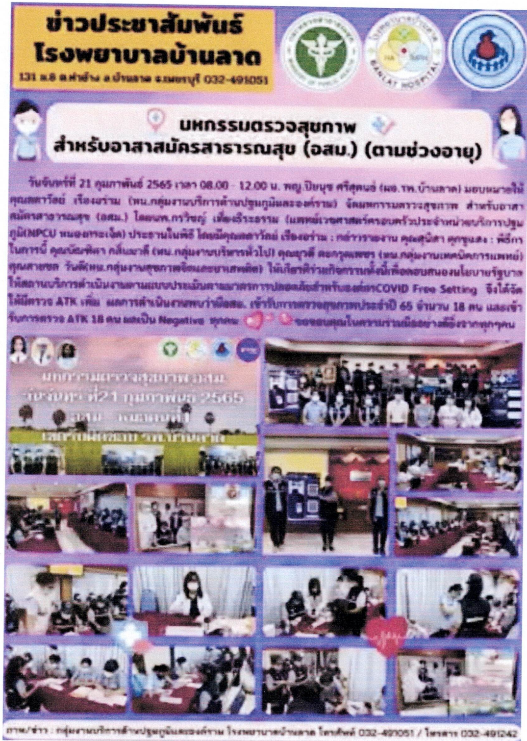
มหกรรมตรวจสุขภาพสำหรับอาสาสมัครสาธารณสุข (อสม.)